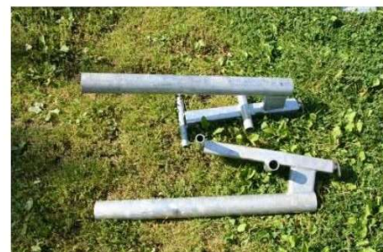
Kovové pólkové spojky pre plavákové sekcie WP