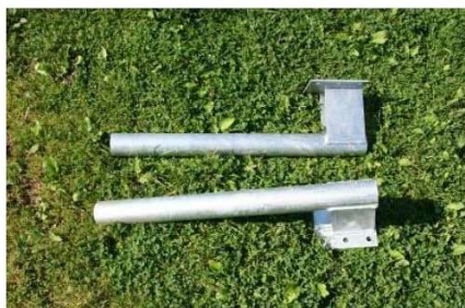
Univerzálna kovová spojka